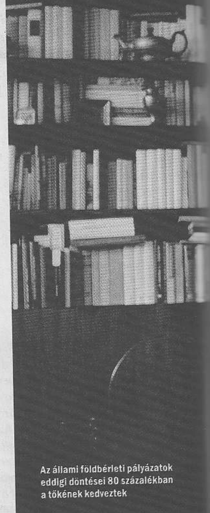
Az állami földbérleti pályázatok eddigi döntései 80 százalékban a tőkének kedveztek

A földbizottság nem a helyi gazdák érdekképviselője, ide a nagyüzemek is tartozhatnak, mert közvetve földművesek a nagy multcégek, a nagytőke képviselői is. Ez a gazdák szempontjából egy álközösség, amelynek valójában semmi beleszólása nincs a földkérdésekbe.