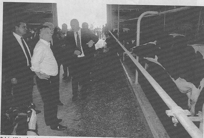
Orbán Viktor és a legendás zenélő tehéntelep

(Forrás: Opten és MVH adatok alapján K – Monitor, 2012. május 18.)